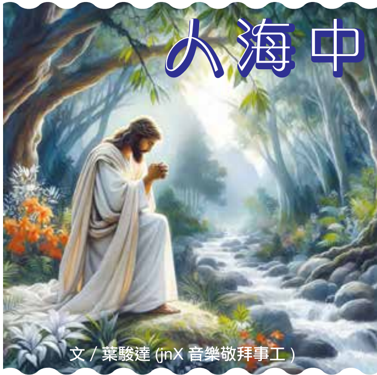
文 / 葉駿達 (jnX 音樂敬拜事工)