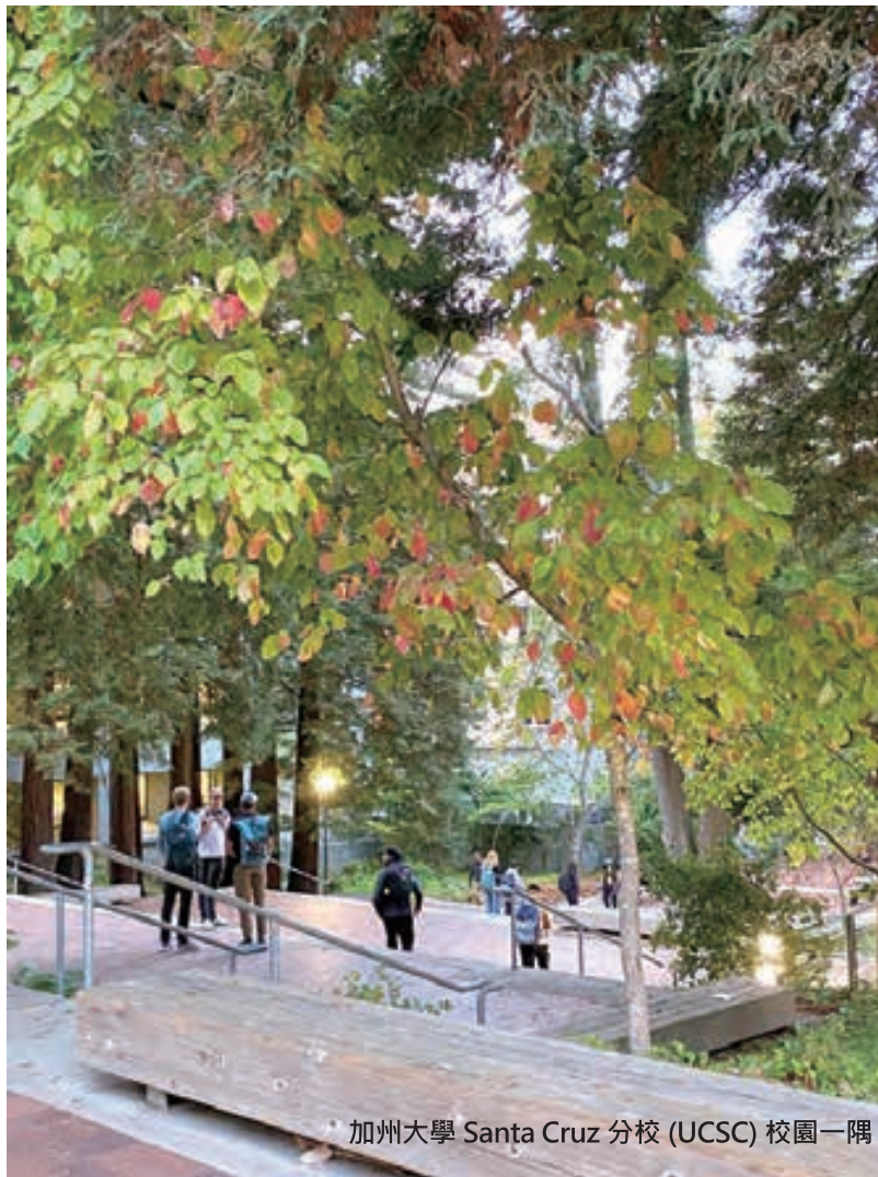
加州大學 Santa Cruz 分校 (UCSC) 校園一隅